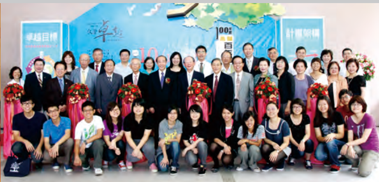
100年10月14日100年度教學卓越計畫成果展 開幕剪綵典禮貴賓師生合影